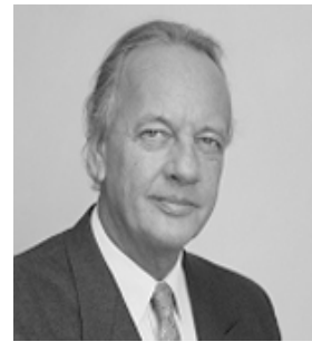
Dr. h. c. August Oetker *1944

Bankier mit Leib und Seele; Diversifikation der Oetker-Gruppe