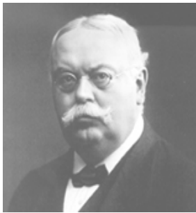
Dr. August Oetker *1862 †1918